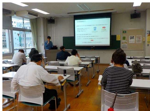
過去の勉強会風景